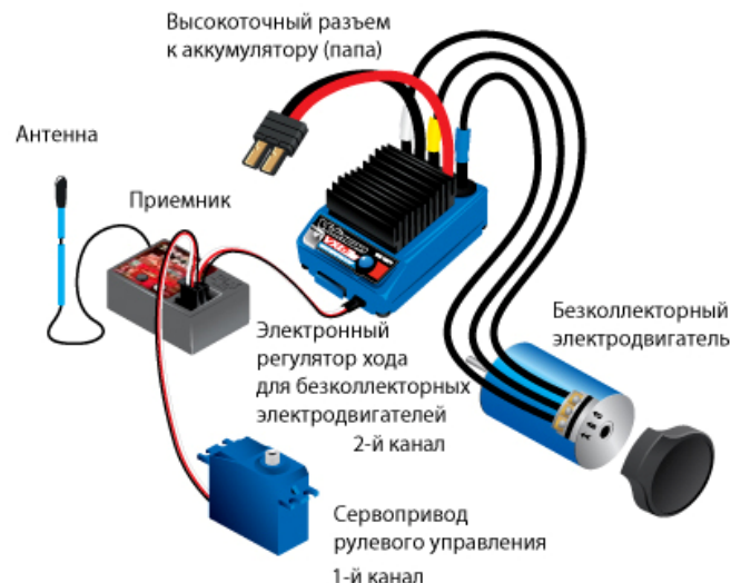
Схема подключения бесколлекторного электродвигателя