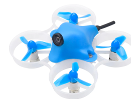
Квадрокоптер × 1