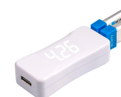
Зарядное устройство × 1