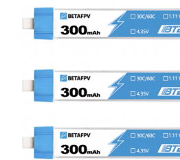
Батарея × 3